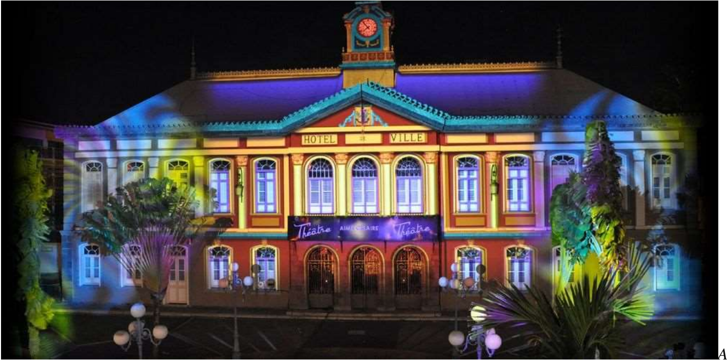
Fort de France, sur le Théâtre Aimé-Césaire

De nombreuses commandes sont annulées, mais le chef d'entreprise propose des projections avec distanciation.