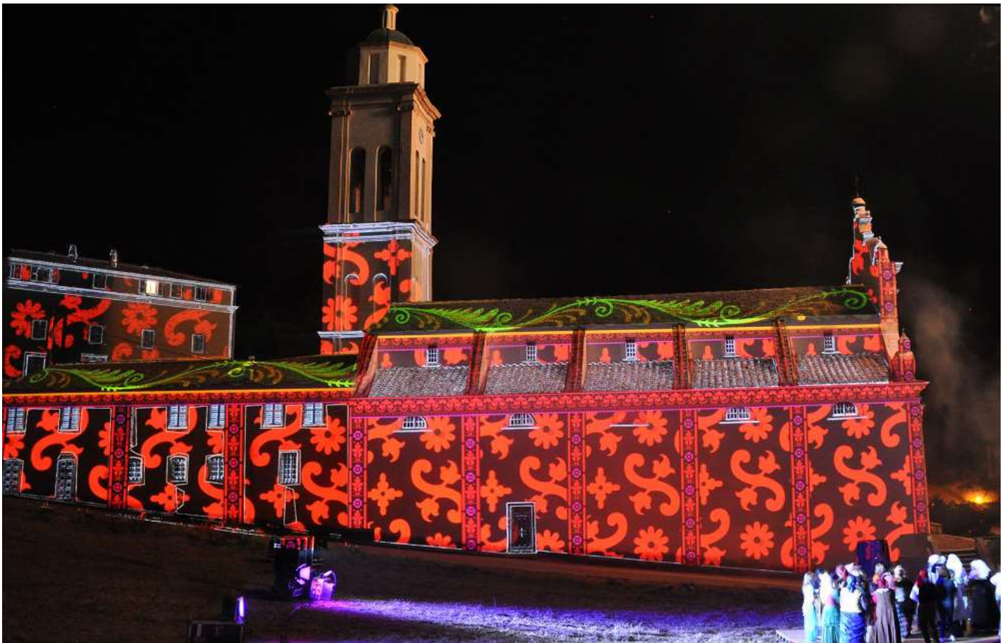
Pour un festival en Corse, à Corbara