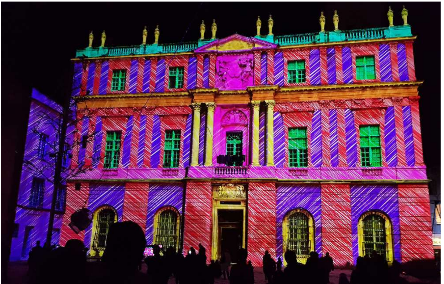
Sur la mairie d'Arles